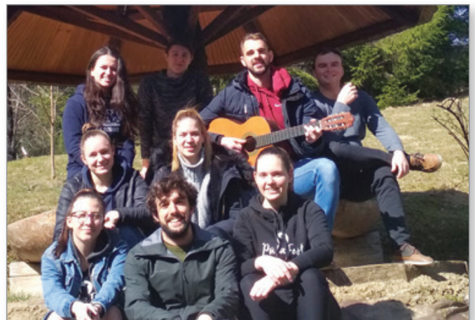
Člani upravnega odbora na delovnem vikendu

Za smeh bomo poskrbeli s Stand up predstavo, za športno razvajanje z ogledom finala lige prvakov v Baru 10 v Voličini ter FIFO turnirjem, za zabavo pa s tradicionalno udeležbo Škisove tržnice, ki bo potekala 9. 5. Za vse člane, ki se želite po družiti s študenti iz klubov cele Slovenije, bo tudi letos organiziran avtobusni prevoz. V preteklem mesecu se je zaključila tudi študentska liga v nogometu, ki smo ga nestrno pričakovali vsak torek, ko se je 8 fantov borilo v dresih Študentskega kluba Slovenskih goric. Fantje so se