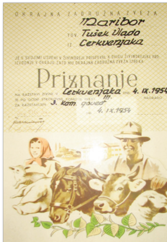
Priznanje Okrajne zadruge zveze Maribor za razstavljenega goveda leta 1954