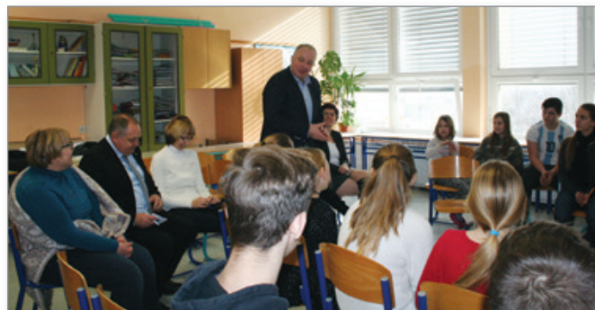
Šolski otroški parlament

Letos je v naši šoli tako kot vsako leto potekal šolski otroški parlament. Prvič v zgodovini otroškega parlamenta se je izbrana tema obravnavala 2 leti. V lanskem šolskem letu se je tako začela obravnavati tema z naslovom Šola in šolski sistem, letos pa smo se znotraj te široke teme osredotočili na medvrstniške odnose v šoli. Mladi parlamentarci so znotraj te teme raziskovali različna področja. Razpravljali so tudi o tem, kaj vpliva na dobre in kaj na slabe medvrstniške odnose, kako vzpostaviti dobre medvrstniške odnose, kako ravnati v primeru spora in kako izboljšati slabe medvrstniške odnose. Parlamentarci so pokazali tudi veliko interesa, da bi med sabo izboljšali slabše medvrstniške odnose in da bi tudi preprečili nastajanje le-teh. Tako so za svoje matične učilnice izdelali plakat z asociacijo in ključnimi besedami, ki jih opominjajo na to, kako ravnati v takšnih situacijah. Izdelane plakate in njihov namen so predstavili svojim sošolcem in razrednikom na razrednih urah. Parlamentarce je zanimalo tudi, kaj mislijo o medvrstniških odnosih v šoli učenci naše šole. Zato so sestavili in izvedli anketo na to temo. Zasedanje šolskega otroškega parlamenta s povabljenimi gosti je potekalo 13. 2. 2019. Med drugim so parlamentarci izvolili tri predstavnike za Medobčinski otroški parlament v Lenartu: Taja Pučko iz 6. b, Pia Peklar iz 9. b in Rene Štelcar iz 9. b.