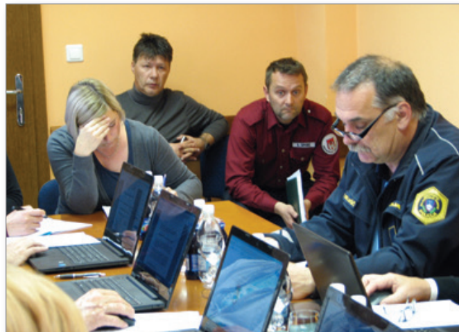
Predstavnika Policijske postaje Lenart in predstavnika Medobčinskega inšpektorata in redarstva Maribor na 4. seji OS