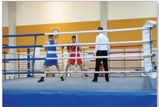
V boksarskem ringu tretjega kola slovenske boksarske lige na Ptuj u soboto, 16. marca