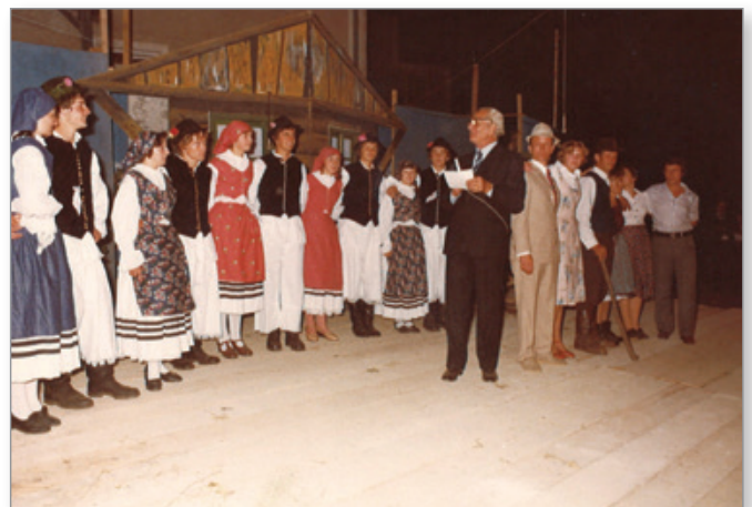
Večer pesmi in plesov 1977

Vse do nastanka lastne Občine Cerkevnik je društvo bilo upravljalec kulturnega doma, njegov lastnik pa Občina Lenart. Z nastankom samostojnih manjših občin je dom prešel v last in upravljanje Občine Cerkevnik. Nekaj let zatem so se izboljšali še pogoji za delovanje. Vodilnim v društvu se ni treba ubadati s vprašanjem in skrbmi ali bo dvorana očiščena, plačane položnice, še sponzorjev za organizacijo in izvedbo prireditev, denimo festivala narodno zabavne glasbe, jim ni treba iskati.