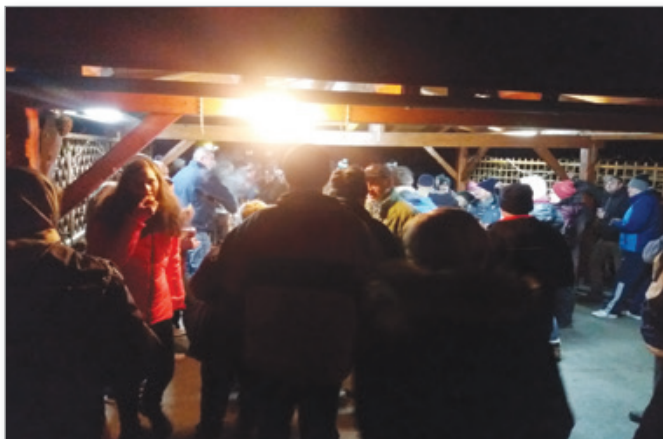
Na eni od postojank