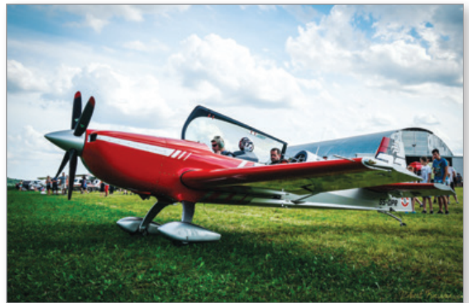
Pilota akrobatskega letala pred poletom

Na državnem prvenstvu v ULN letenju bomo poskušali ponoviti v letu 2016 doseženo odlično 1. mesto naše ULN posadke (Darko Milanović, Matej Vogrinčič). Glede na zasedeno tretje mesto na DP v letu 2018 se načrtuje tudi udeležba na EVROPSKEM prvenstvu.