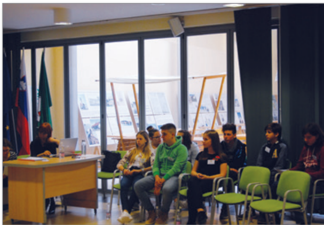
Medobčinski parlament v Lenartu