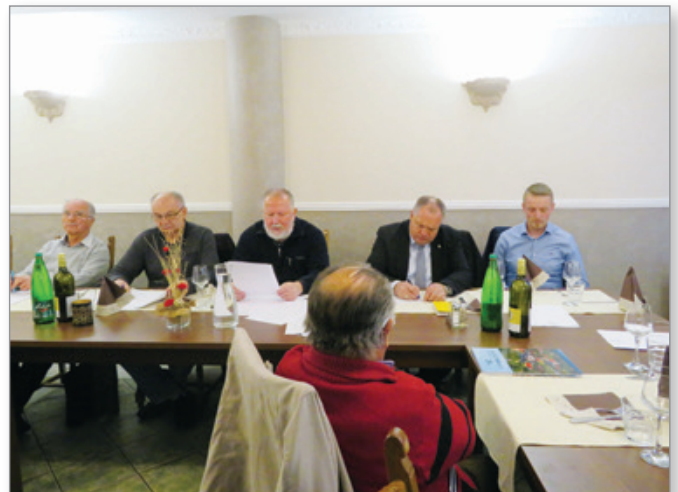
Člani Slovenskogoriškega foruma so razpravljali o strategiji lokalnega razvoja.