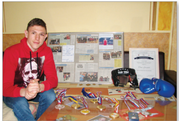
Ponosen na sadove dela in osvojene medalje