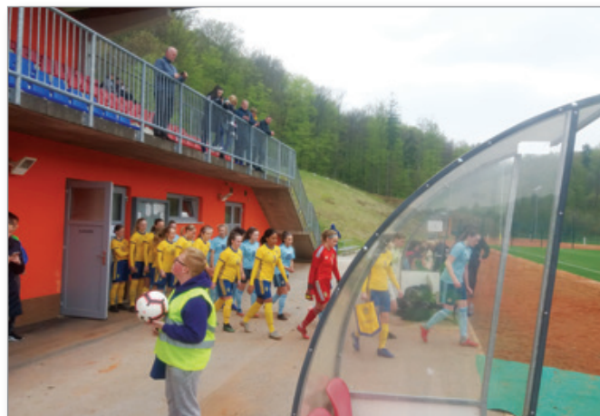
Začetek tekme Švedska–S. Irska

Na njem so nastopile dekliške reprezentance do 16 let. Ker je bilo Zrnje ob koncu turnirja že v tisku, vam lahko ponudimo le fotografiji s tekem. Več v prihodnji številki.