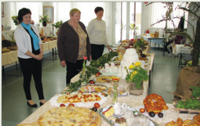
Fotografije in besedilo: Franc Bratkovič

V Cerkvenjaku pa že leta ta čas svoj delež v uvod velikega tedna prispevajo tudi članice Društva kmečkih deklet in žena, ki pripravijo razstavo Velika noč nekoč in danes. Privlačno razstavo velikonočnih jedi in z njo povezanih utrinkov si je bilo mogoče v avli Vlada Tušaka ogledati v soboto, 13., in v nedeljo, 14. aprila.