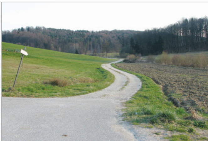
Ta odsek ceste v Andrenški grabi v smeri Lübe vodice bo letos dobil črno prevleko.

Pri predzadnji točki dnevnega reda tretje seje občinskega sveta Občine Cerkevjak so se seznanili z letnim poročilom o izvedenih ukrepih iz akcijskega načrta lokalnega energetskega koncepta in njihovih učinkih za leto 2018. Aktualna je bila tudi zadnja točka seje Pobude in vprašanja.