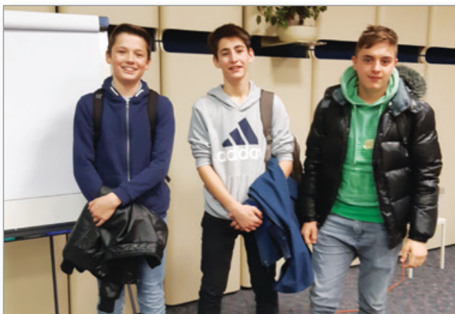
Regijski otroški parlament v Mariboru