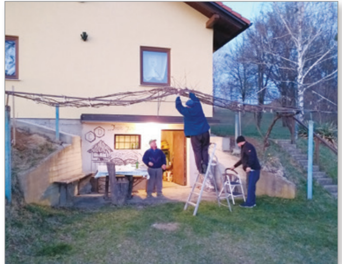
Urejanje čebelarskega doma v marcu